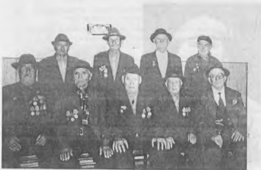
Ветераны с. Кумыш. 1999 г.