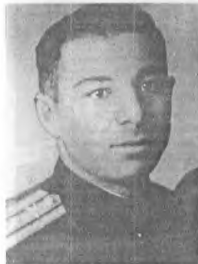
ЭБЗЕЕВ Аскер Сеит-Батдалович