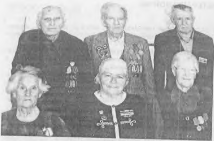
Ветераны п. Правокубанского