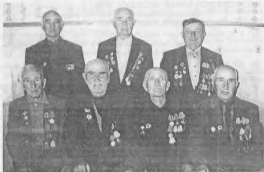
Ветераны п. Нового Карачая, 1999 г.