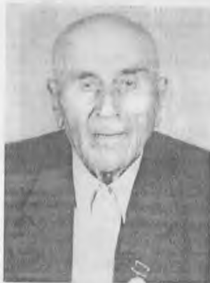
ЭЛЬКАНОВ Бекмырза Барбиевич