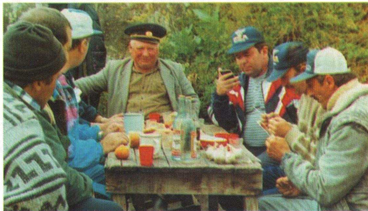
С друзьями в горах