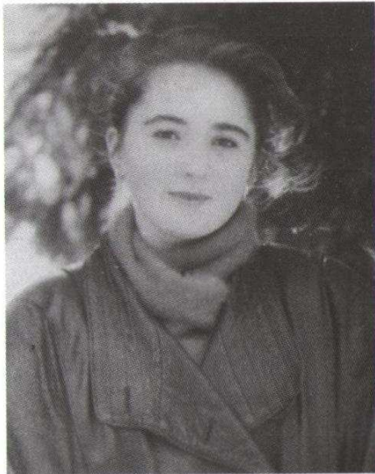
Ей было только 19...