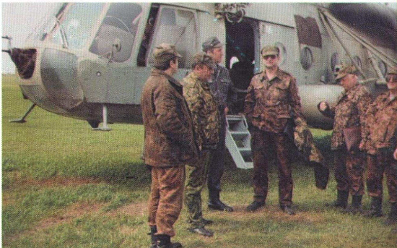
В вертолетном полку