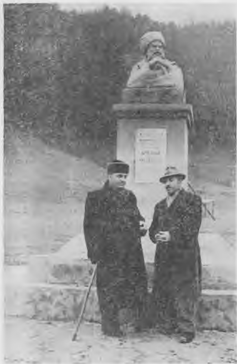
Къуди Къайсын бля Керим Огаров. Къышманъ хосерутмесини адында.