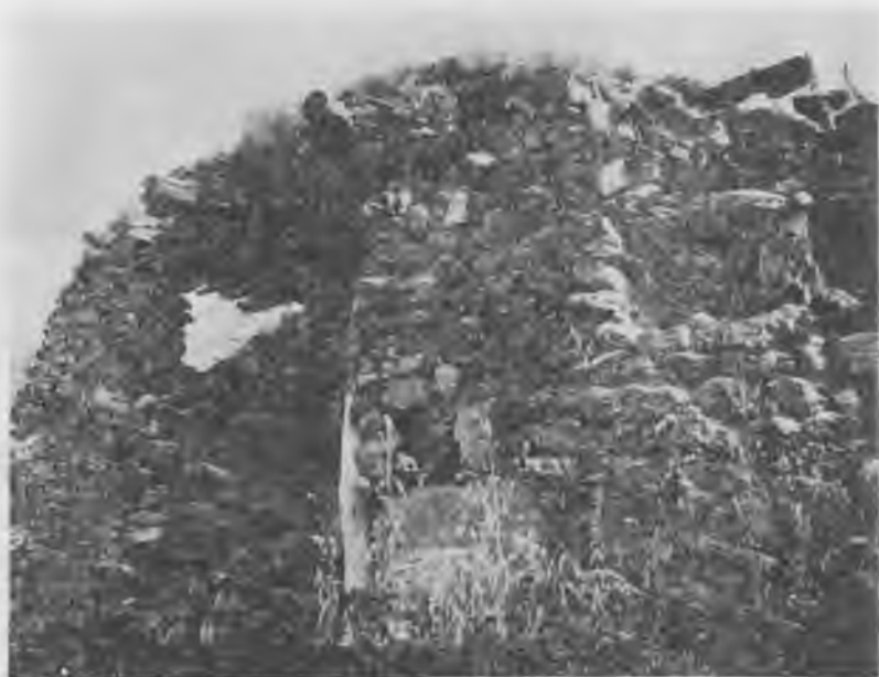
Кызылдын гөрбөжөгү Шыбыл. 1962 жыл.