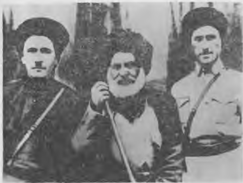
Қазим эдилери Солтанланы Жаша бла Халимзиланы Токайны биргесине.