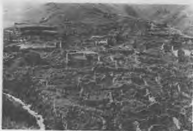
Қазимни туугъан эли Шыкъы. 1962 жыл.