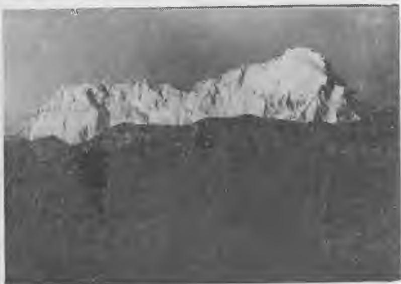
«Арабда, Тюркде да айланып келдим. Энтда Бзылгыны тауларын көрдюм!»