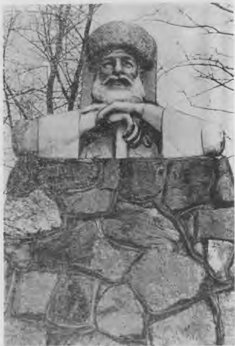
Кызимге Бабугент элге кирген жерде ишленген эсертме.