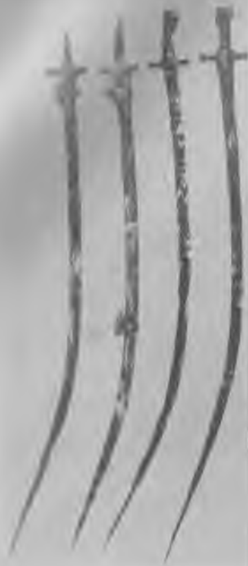
Сабли из кабардинских курганов

Кабардинский курган XIV—XVII вв. содержит набор оружия — длинные сабли, лезвия которых нередко превышают 1 м, колчаны с десятками стрел, кинжалы, ножи, ножницы для стрижки овец, железные кресала, скобы для скрепления деревянных погребальных колод и другие предметы ремесленного производства. Почти те же предметы обнаруживаются в балкарских захоронениях, за исключением сабель.