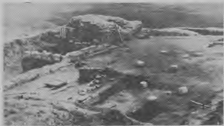
Мечеть XIV века на Нижнем Джулате

горы, как гнездо хищной птицы, на такой высоте, что пущенная стрела туда не долетала».