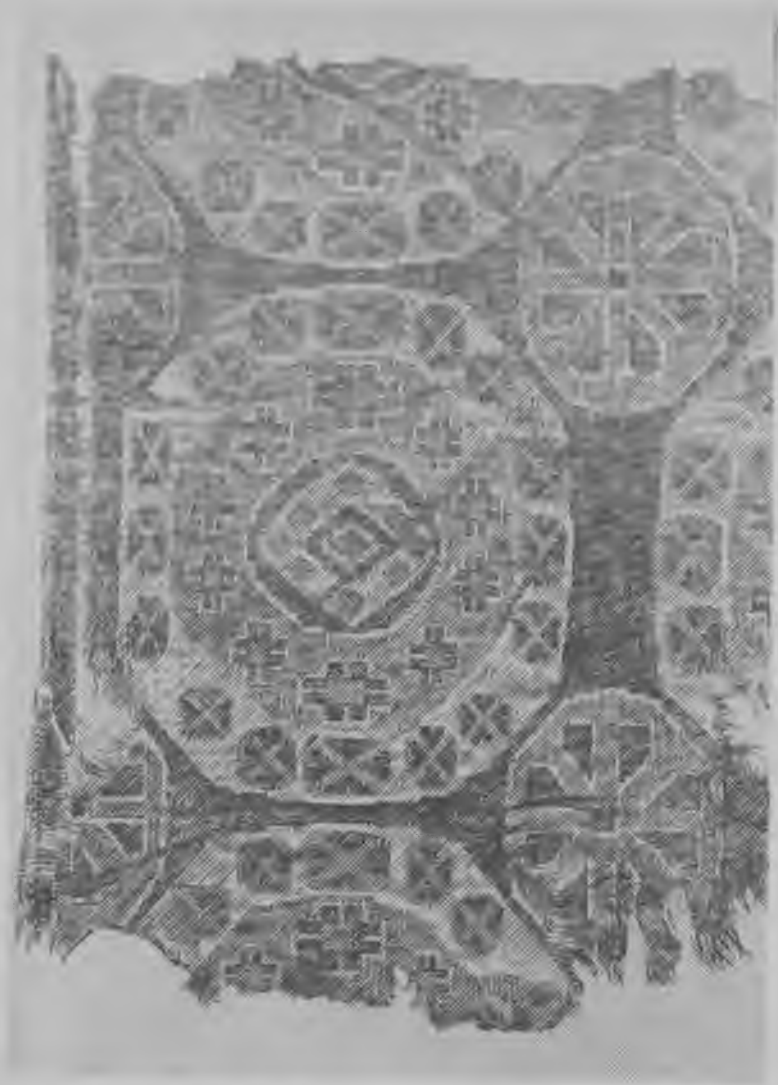
Образцы средневековых тканей

Особого искусства достигли женщины в золотошвейном рукоделии. Интериано писал, что они «не занимались никакими другими работами, кроме вышивания