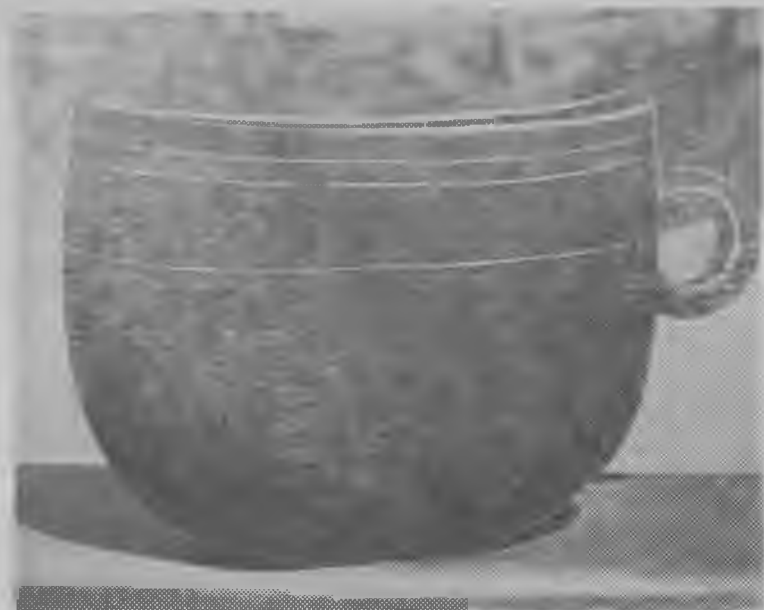
Деревянная домашняя утварь балкарцев

археологических памятниках рассматриваемого времени почти нет.