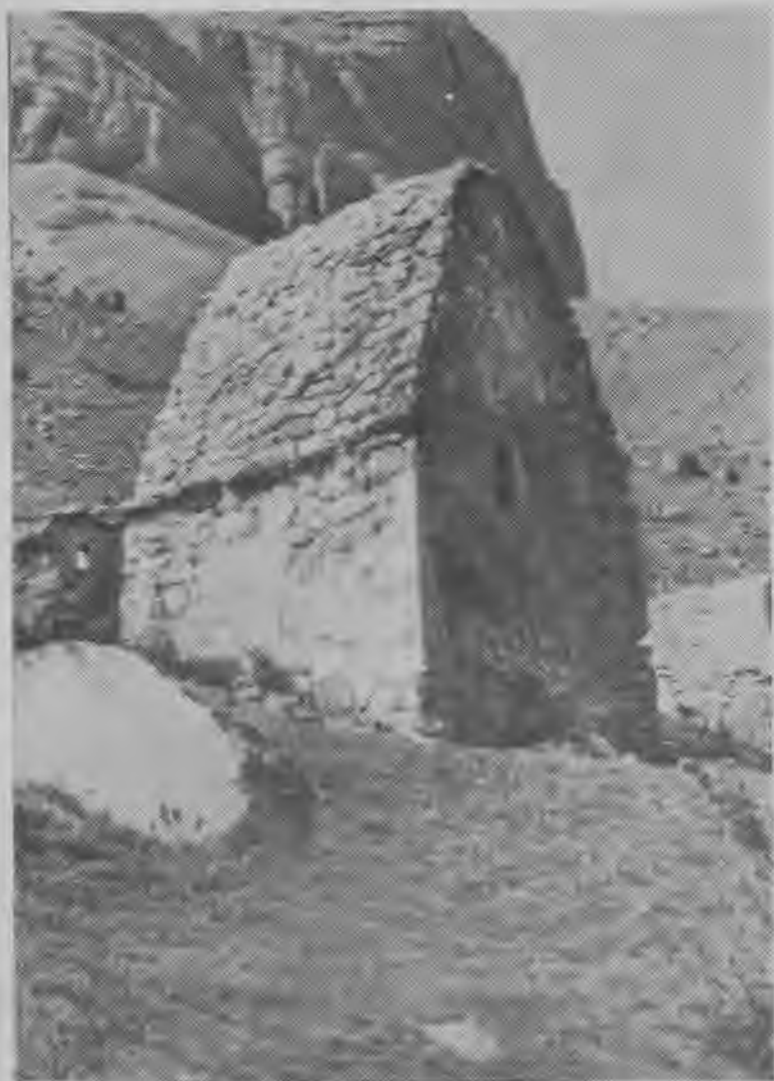
Средневековые мавзолеи в Балкарии