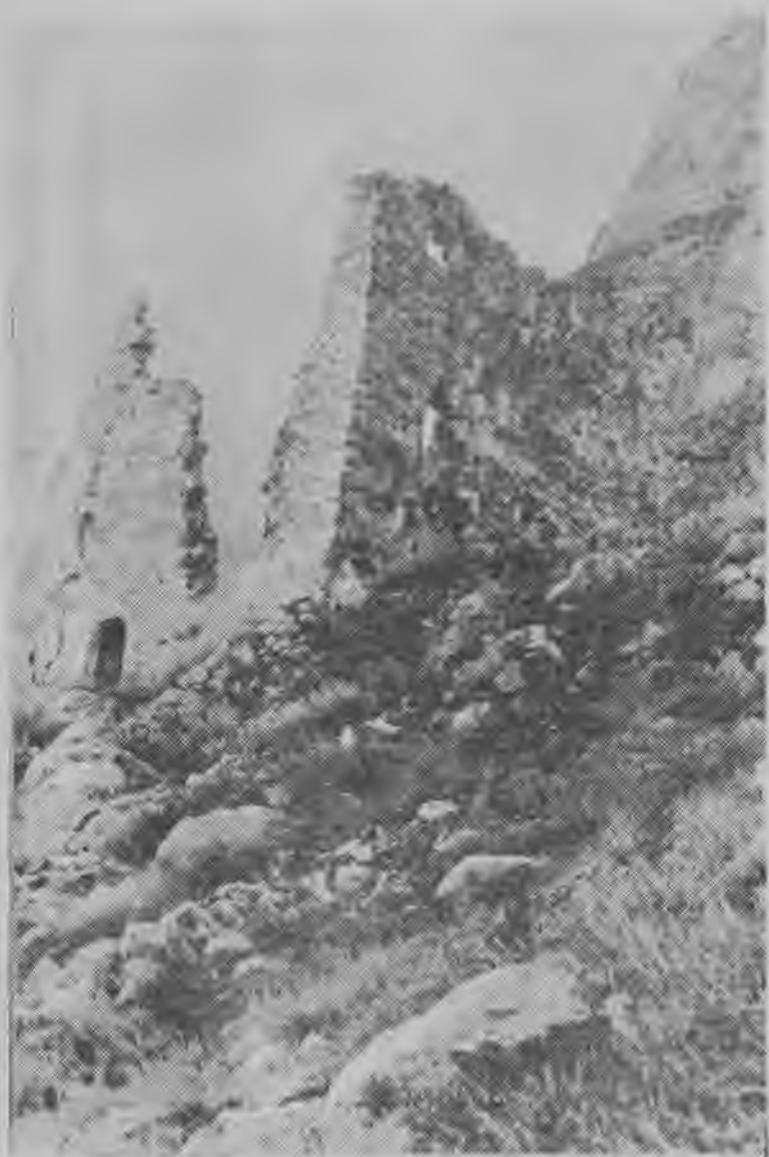
2-я башня Абаевых