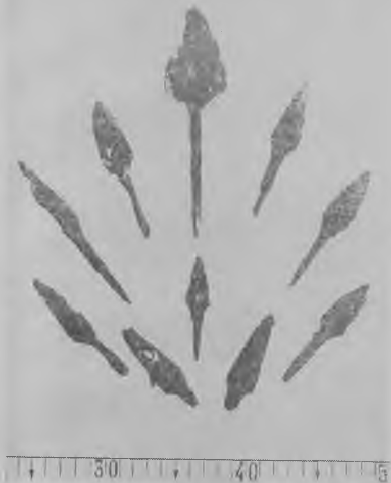
Стрелы из кабардинских курганов

По заключению специалистов лаборатории естественных методов института Археологии АН СССР, на основе анализа железных предметов из памятников Кабардино-Балкарии можно утверждать, что в основе кузнечной технологии того периода лежит свободная ковка металла с последующей тепловой обработкой гото-