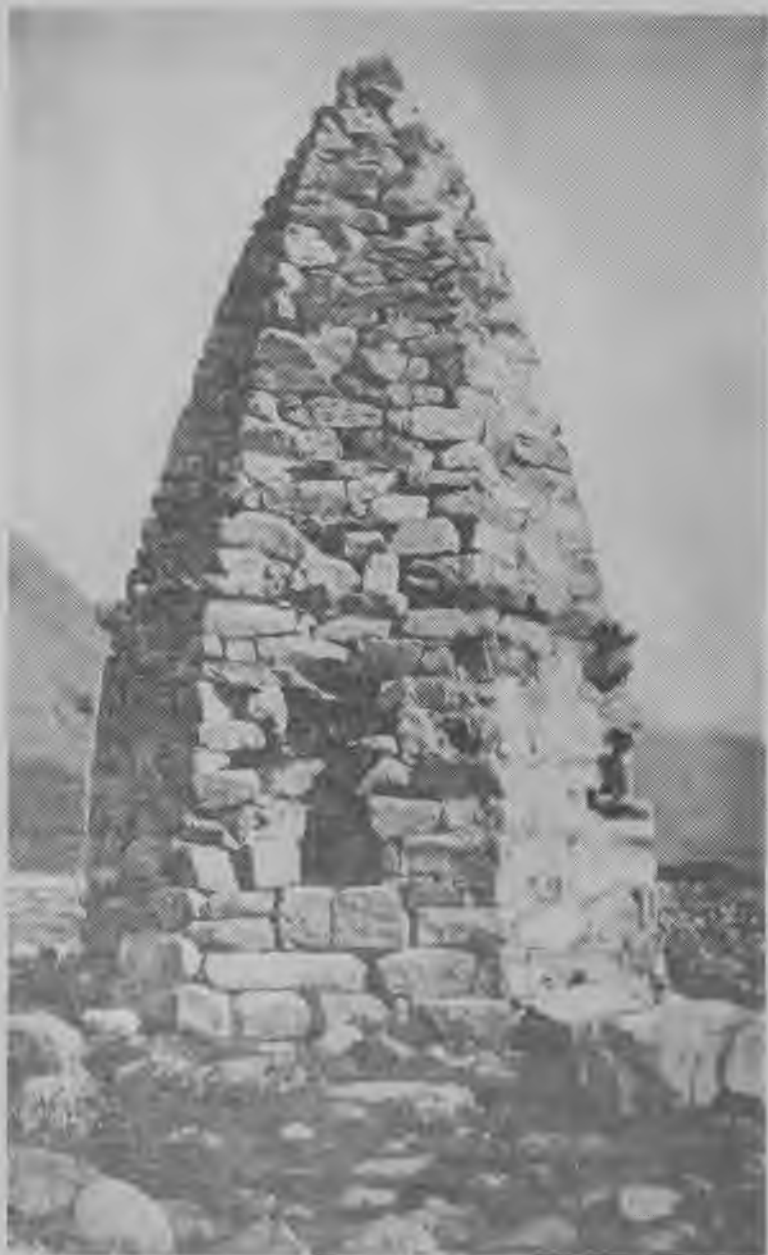
Средневековые мавзолеи в Балкарии