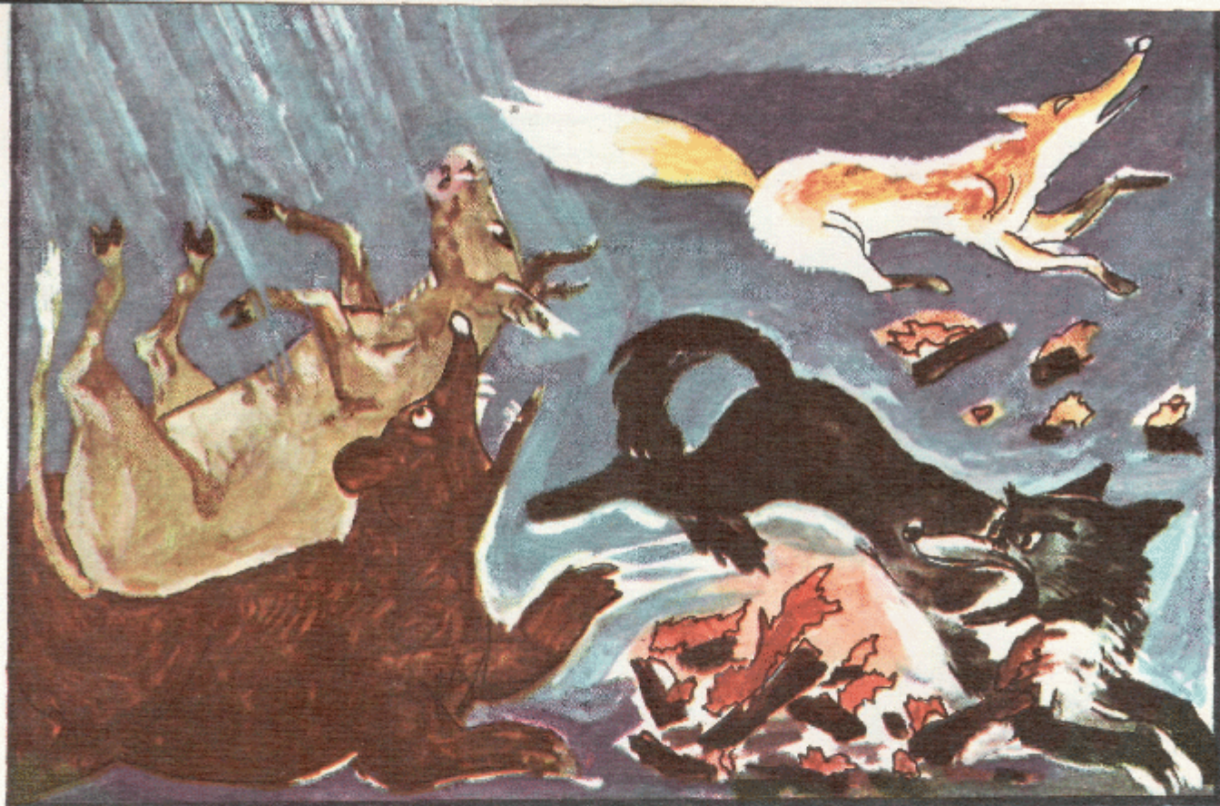
Сур. М. Татроковнуну.