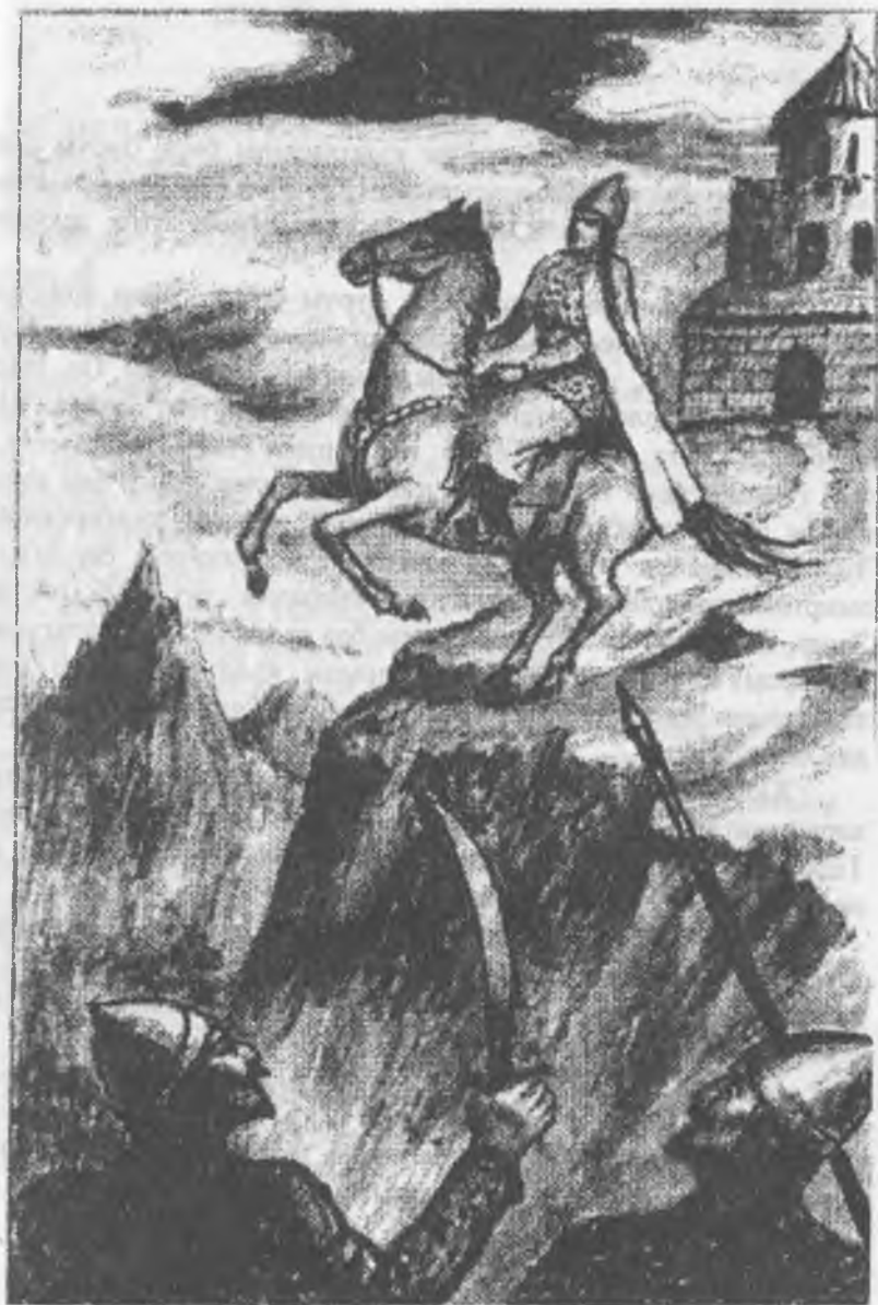
ЗУРУМ БИЙЧЕ