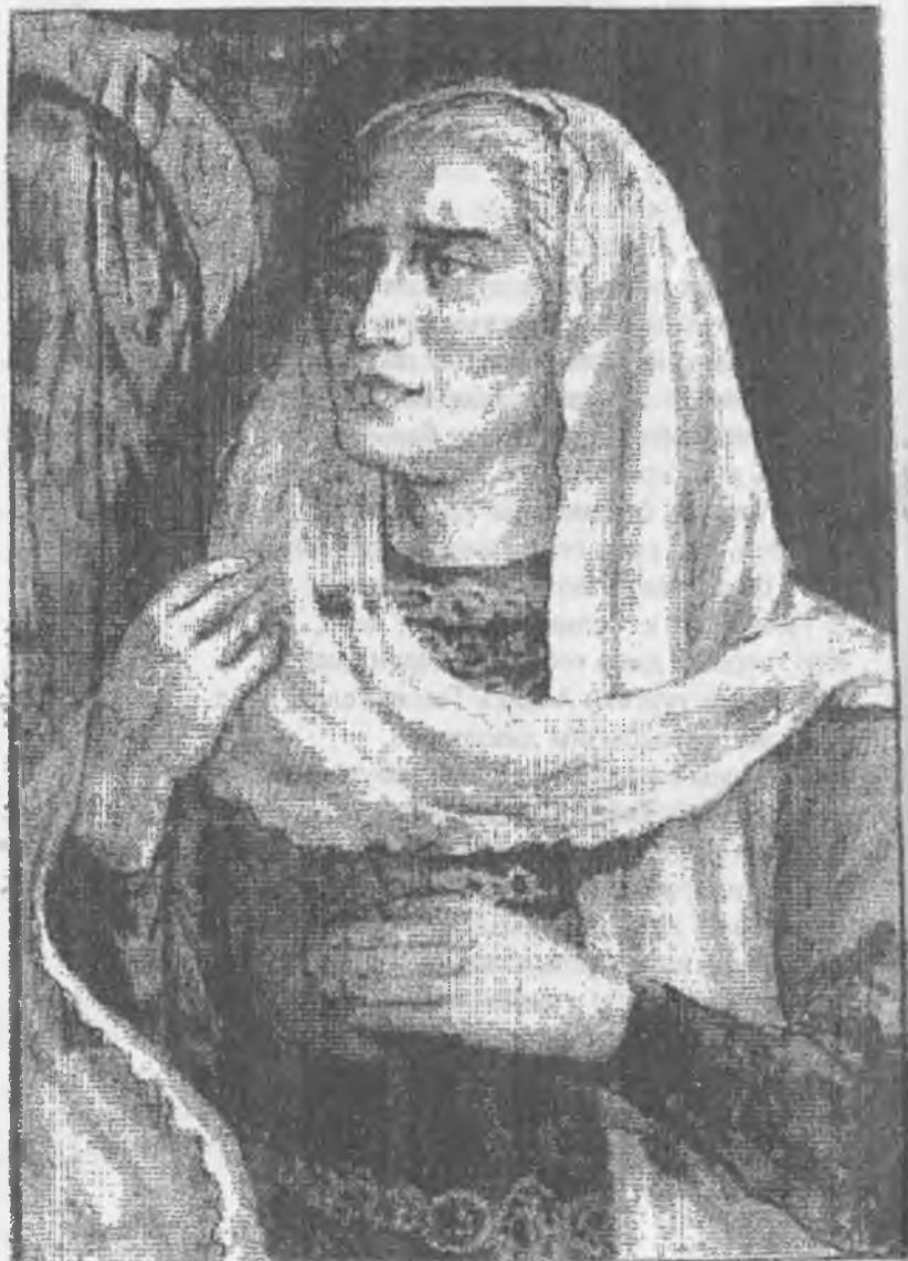
АКЪБИЛЕК БИЙЧЕ Суратчы Хубийланы В.