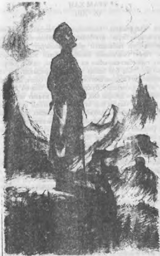
Трам хан. Суратчы Хабибланы М.