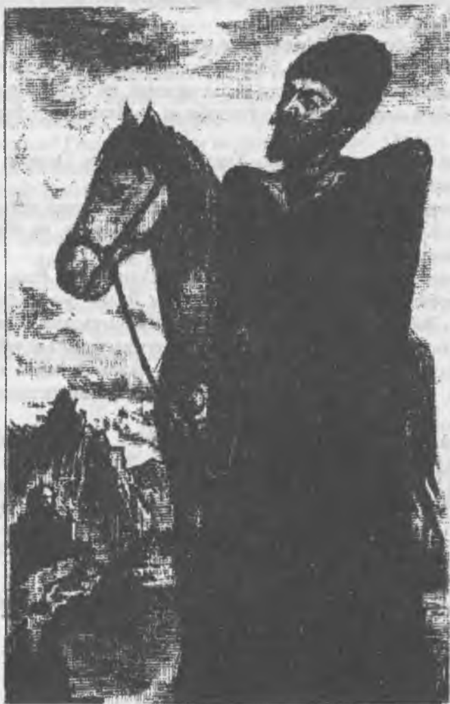
Семен улу Кьалтур Суратчы Хубийланы В.