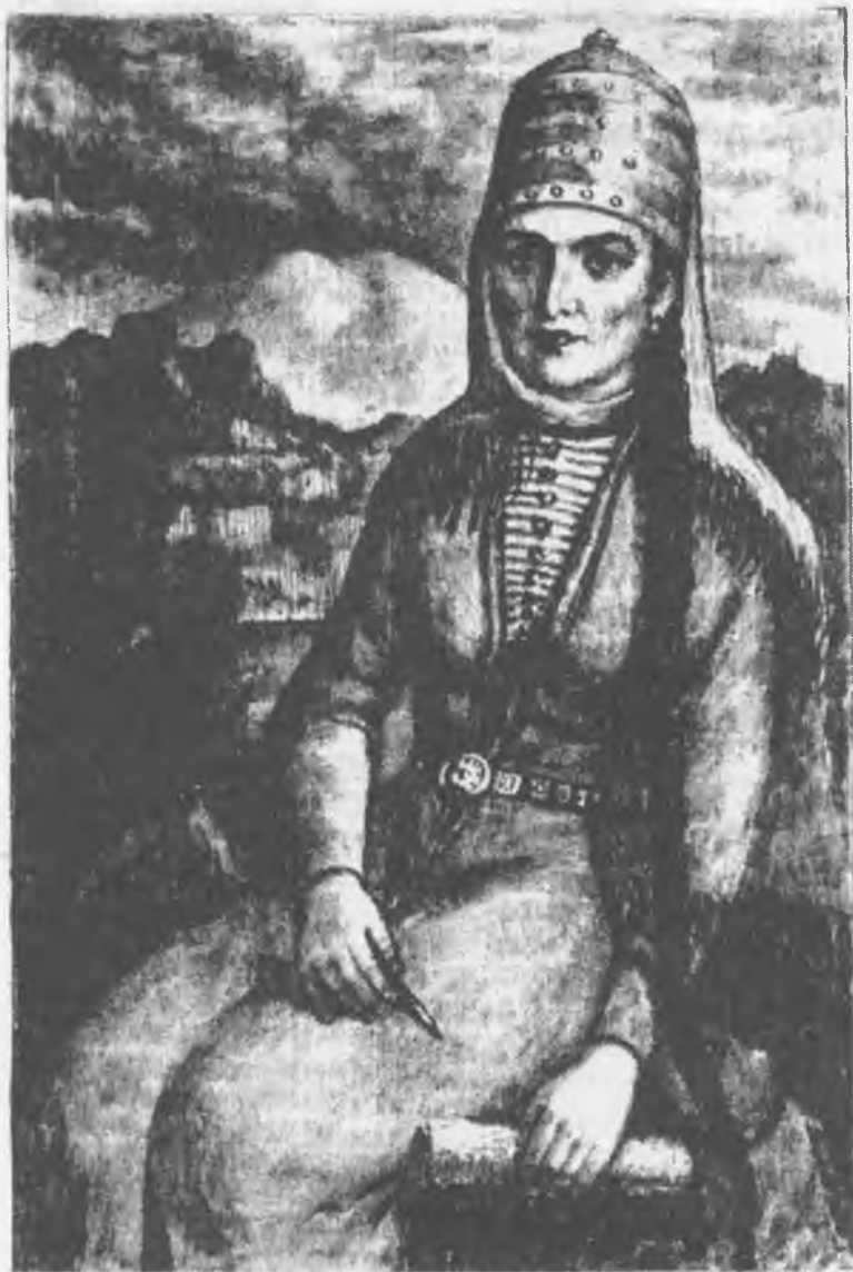
ГОШАЯХ БИЙЧЕ Суратчы Хубийланы В.