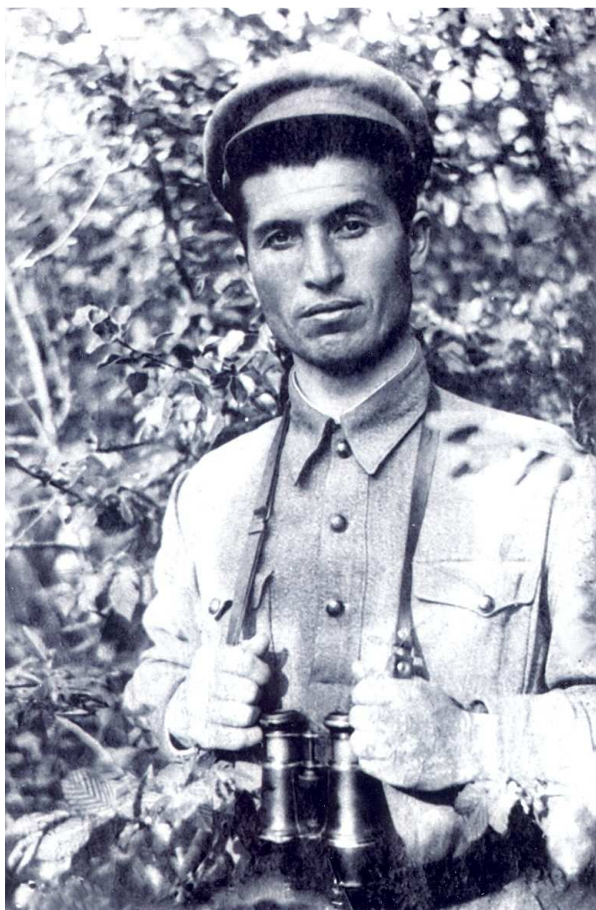
Перед началом войны.