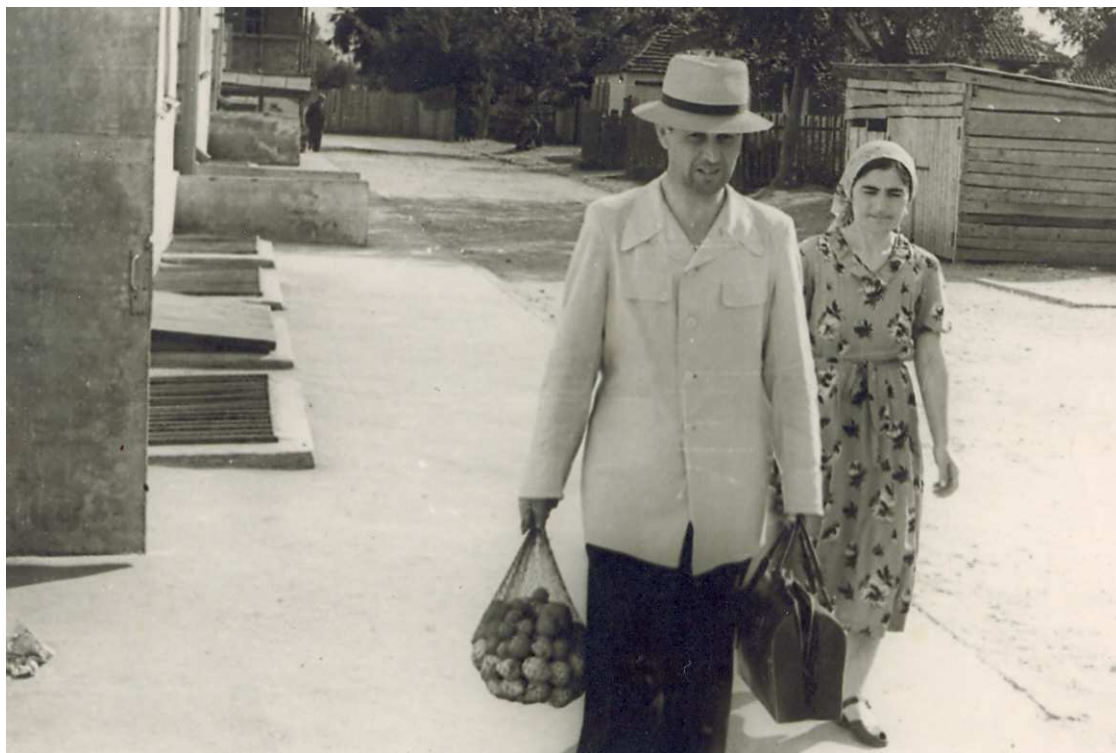
Поэт – джентльмен. Тяжёлая ноша не для женских рук.