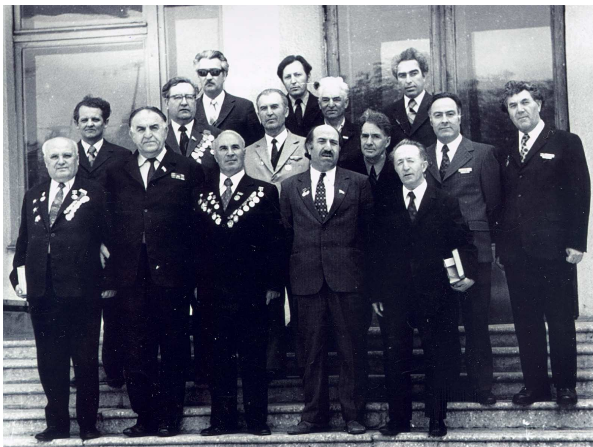
Кабардино-Балкарские литераторы в юбилей Дня Победы.