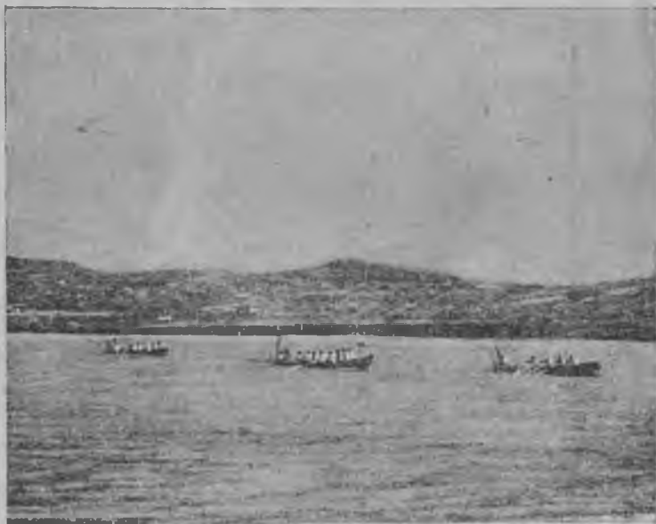
9-s u r.

Oktjabr revolysija Resejni xalqından patcahıyq, pomeşçiklik porjadkanь çuvuv. tşyna atdı, anь ornuna Sosialist Respublikalanь Sojuzlarь quraldı. Anь icinde xar millet varьsьda tendi, vaşcьlyq etgen millet coqdu. Sovet Sojuzda „tş adamla“ ezilib, unuqub qulluq etiv turqan milletle endi varьsьda kesleri vaşlarьna erkindile. Ma bu sebevden kesi syjuv doşulqan milletle varьsьda qьralnь saqlamaq-lyqny isine doşuladyla.