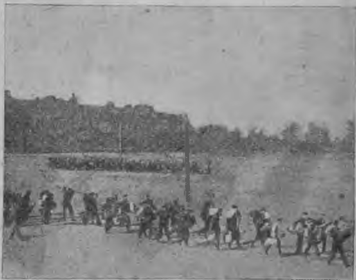
11—s u r.

Doprizivnikleni çyşan zamanda oquv punkt- lada politprosvet qulluq etiledi, etilgen qulluqda çaşлань ana tillerinde voladъ. Oquşanlarъn igi aşььr uscun oquv punktla ana tilde çazyşan plakatladan diagrammaladan daşьda anь kivik oquvşa kerekli zatladan kereklisi caqlъ bir tolurşa-çetişimli volurşa kerekdi.