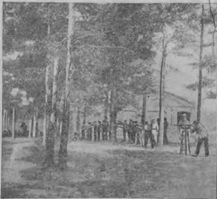
6 - с и т.

vzvodla volub съѡарѡа voladъ. Ol qavmlanъ alla- гъnda asker texnikanъ ѡsmekligi sevevli vek ullu vorcla vardъla. Xar ѡyldan ѡyloa ol aurdan aur vola kesine artъq es izlej tevrejdi. Ol sevevden kadrovъj castla voloqan ѡerde askerge varъrdan aloqъn yren- meklik alajda ullu maqana aladъ. Ala doprizivnikden qazavatcъ etmeklikni igi ѡenilendiredile. Alajda yrenen qaum askerge varoqan kynlerinde oquna dezurna volub vaqlarca voladъla, ala qulluqdan yjge var-