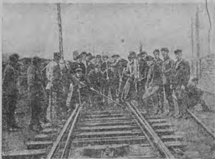
7—s u r.

Qaraulda qulluq etmeklik ulla eslilik izlev emda qьral mylkny saqlamaqьqda ulla saqlьq izlejdі.