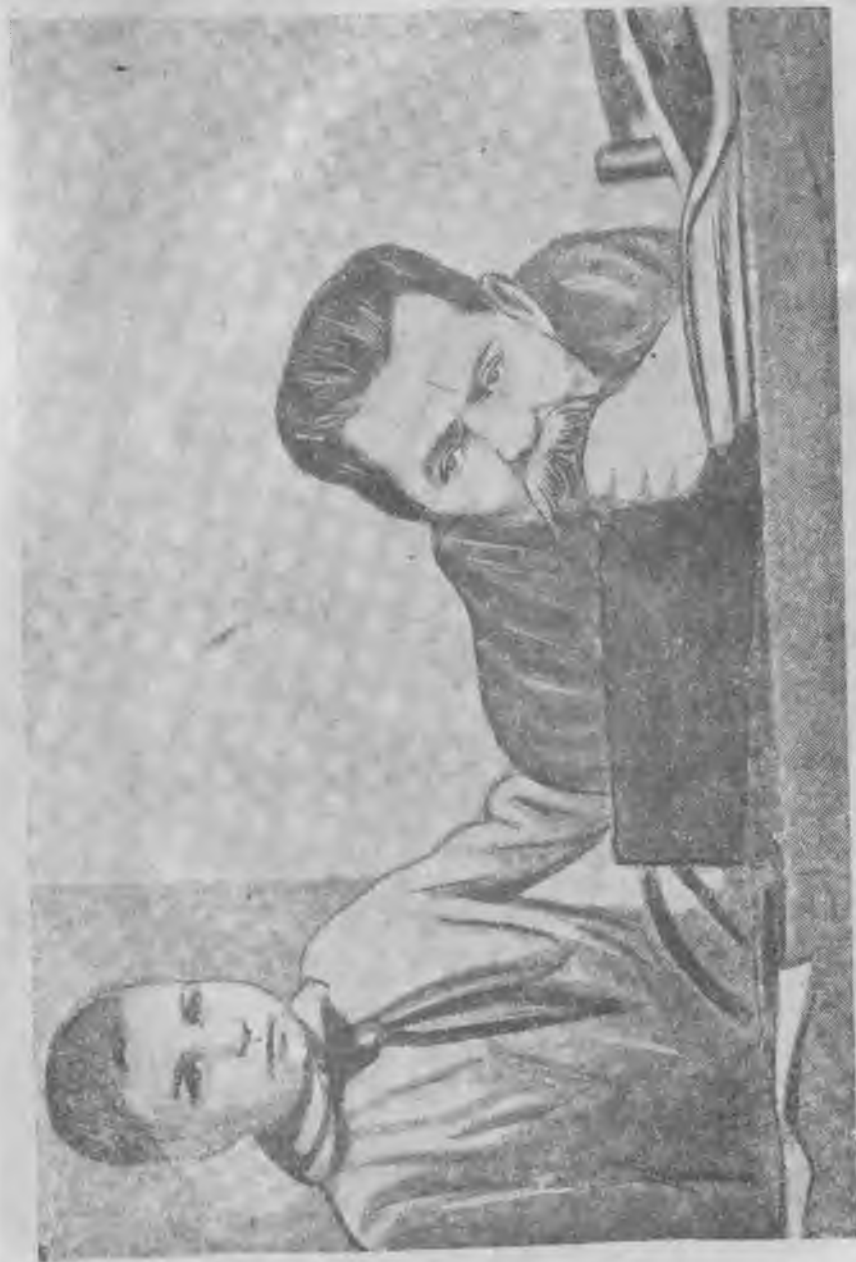
Maksim Gorkij Moskwa şollanb birinde.