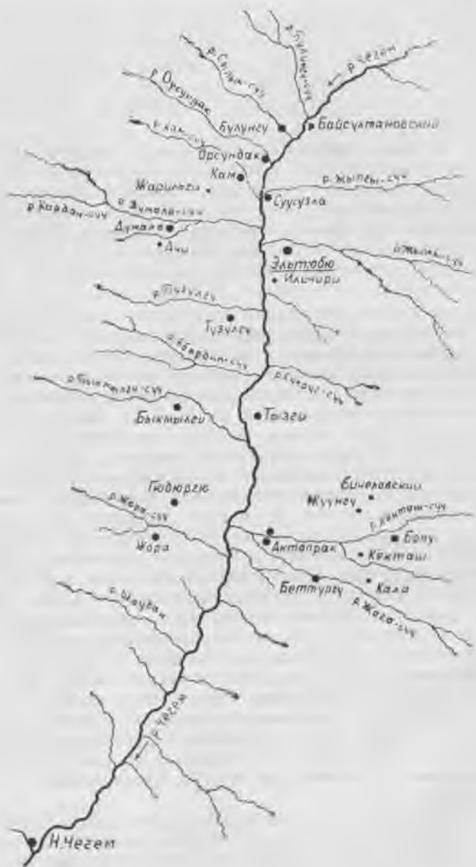
Схематический план размещения населенных пунктов Чегемской сельской общины в конце XIX — начале XX века (схема 9)