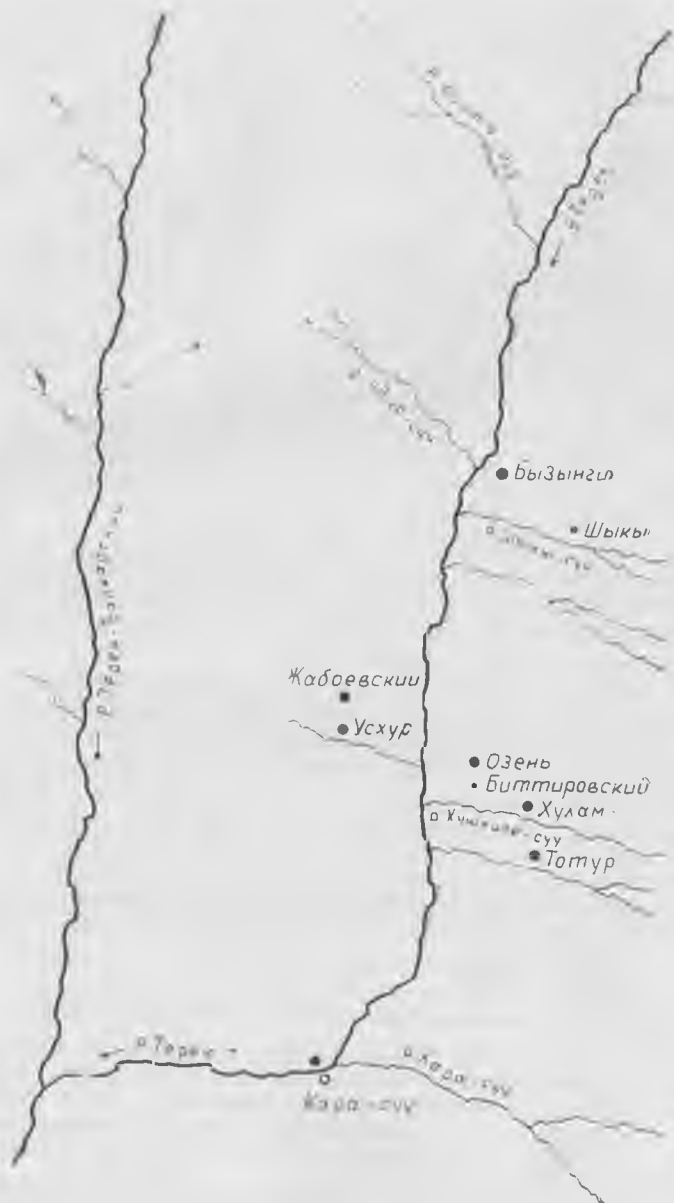
Схематический план размещения населенных пунктов Хуламской и Безенгиевской сельских общин в конце XIX — начале XX века (схема 8)