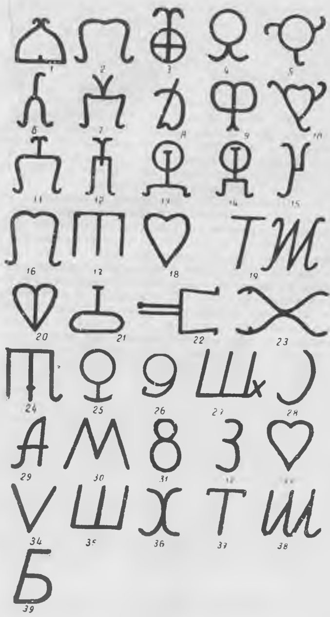
Тамги (схема 11)