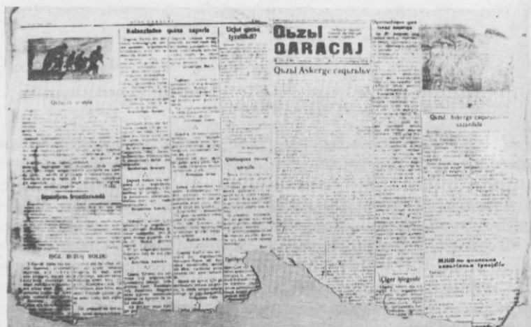
Кёчгюнчюлюкде эркеленген газет.