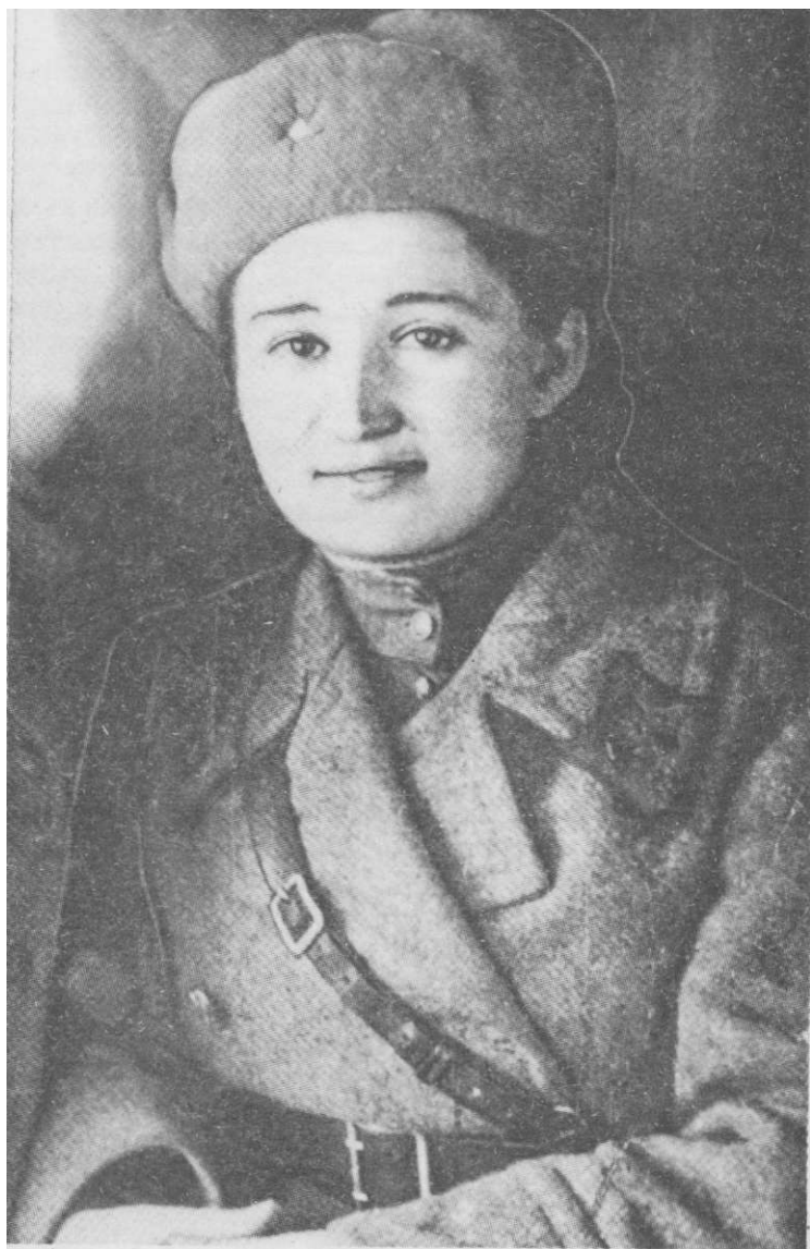
Эрикгенланы Зоя кызауатны кёзююнде.