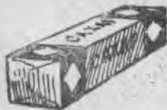
Татлы акъ шекер.