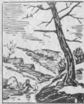
Суучукъла ашыгъыб барадыла.