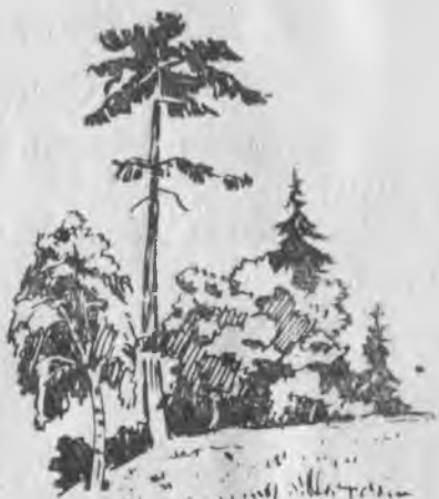
. . . рек . . . .