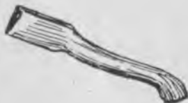
Балта саб Балтаны сабы

Китаб, тоб, саб дегенча сёзлени ахырында тунакы п таууш эшитиледи, алай а б хариф джазылады.