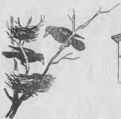
Грачла да келдиле.