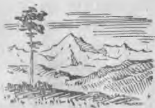
. . . ла.

14-чю иш. Бир, эки, юч, төрт, беш бёлюмю болган сёз- ле табыб джазыгъыз.