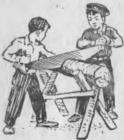
сабий. . . .