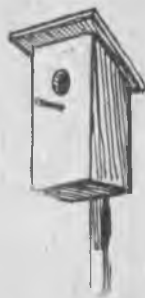
Чыпчыкъгъа юй хазырды.