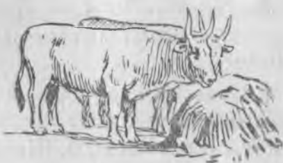
Ёгюз . . . .