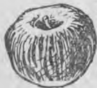
Тегерек кызыл татлы алма.

85-чи иш. Суратлагъа къарагъыз. Аланы тюблеринде джазылгъан сёзлени окъугъуз да, соруулагъа джууаб беригиз.