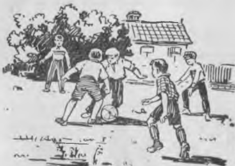
Сабийле тоб ...