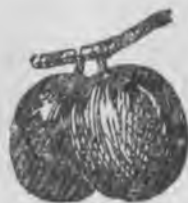
Татлы къара эрик.