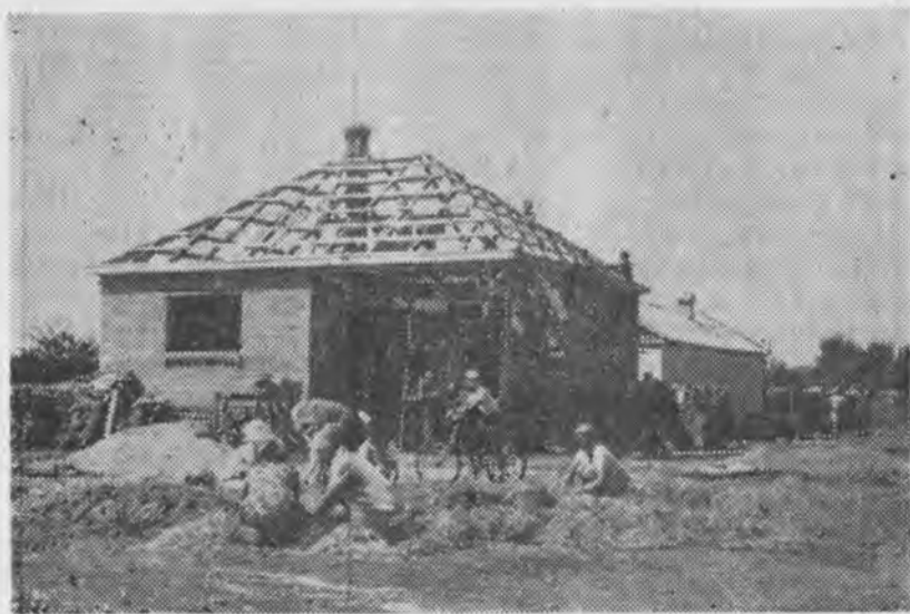
Рис. 3. Взаимопомощь «талакъя». (Аул Эркин-Халк, 1975 г.).

Если в семье есть старик, то первый камень под фундамент кладет он. Строительство дома начинают в начале недели весной. Правда, эта традиция нарушается, если хозяева не могут по различным причинам взять в это время трудовой отпуск. Многие застройщики, чтобы в доме был всегда достаток, под первый камень фундамента кладут монету. У степных ногайцев под угловой камень сыпят жмень пшеницы и ячменя. Традиционно обмазку или штукатурку дома начинают с внутренних стен.