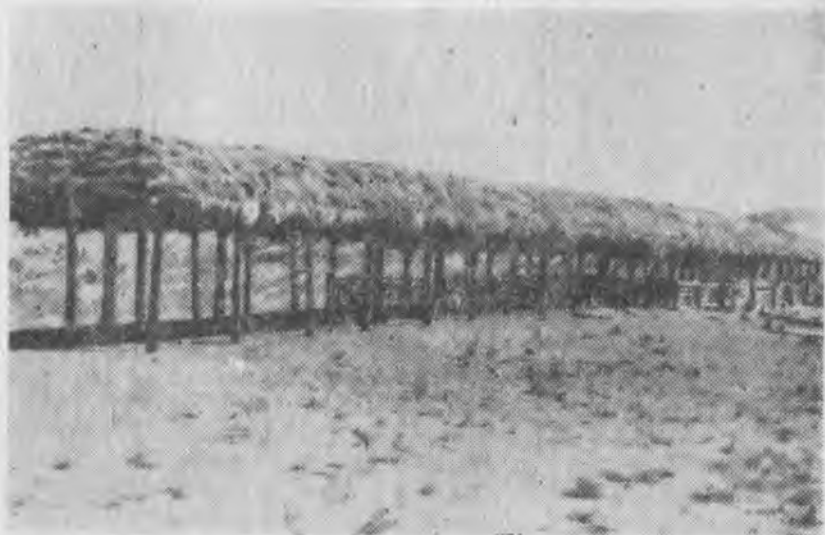
Рис. 1. Летний навес для овец. (Племовцезавод «Червлёные буруны», 1976 г.).

(шетен кѳора), а с других сторон обкапывали рвом, на вынутый грунт накладывали ветки терна (коьген) или облепихи (мазбак).