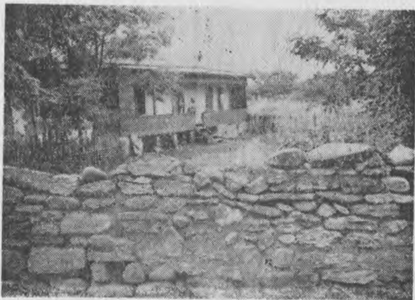
Рис 2. Дом, построенный в конце 90-х годов XIX века. (Аул Эркин-Халк. Фото 1971 г.).

Наличие различных строительных материалов, ранний переход к земледелию позволило кубанским ногайцам раз-