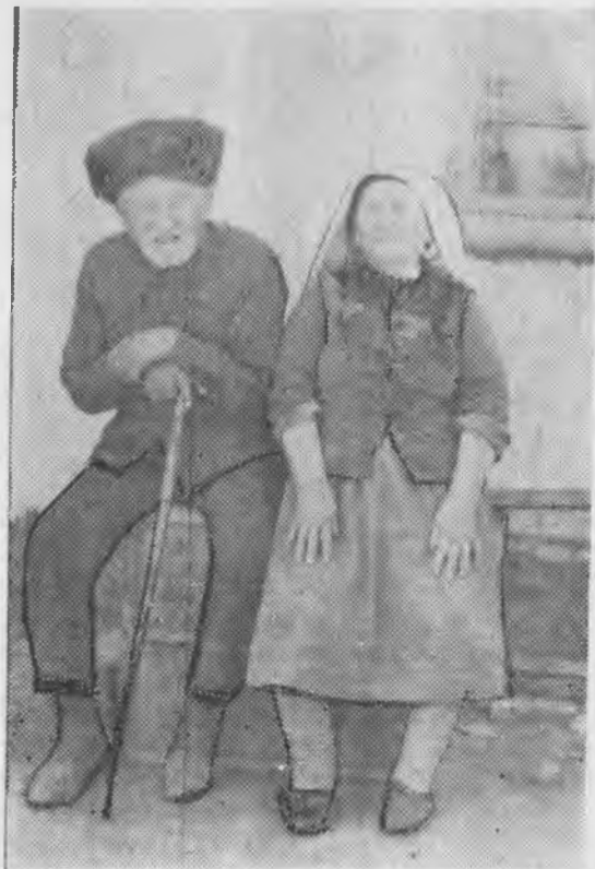
Рис. 8. Пожилая чета в традиционной одежде. (Аул Терекли-Мектеб, 1976 г.).

В поминальных обрядах, наряду с ближайшими родственниками, участвуют преимущественно лица старшего поколения. На поминки старики приходят в шапках, а женщины в черных платках. Молодые люди в этих случаях не всегда придерживаются обычаев, поэтому на похоронах и поминках можно встретить разноцветные, хотя и темные головные уборы.