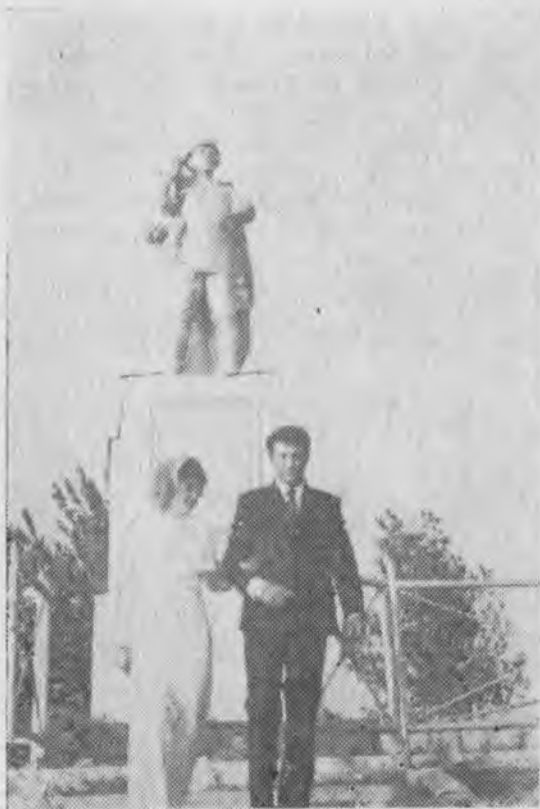
Рис 7. Молодожены у памятника. (Аул Эркин-Халк, 1975 г.).

рибутами свадебного наряда. Если в прошлом после свадьбы невеста полностью закрывала волосы, то теперь она носит современную прическу, на голове легкий газовый платочек.