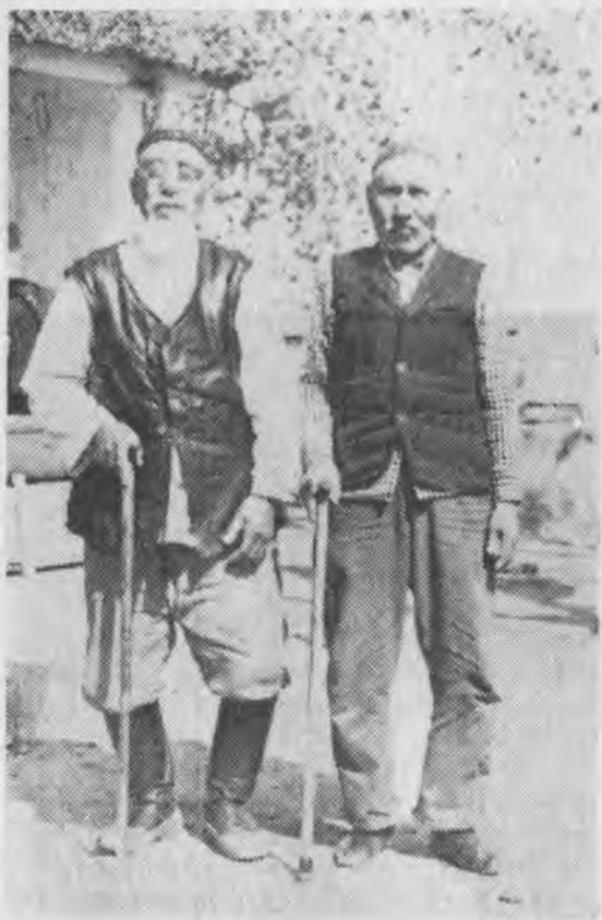
Рис. 5. Пожилые мужчины в традиционной одежде. (Аул Абрам-Тюбе, 1976 г.).

ка (кыспа), изготавливаемая на вате или из бараньей шкуры. Безрукавку, как правило, шьют местные мастерицы. Нательное белье стариков фабричное, но встречаются и индивидуального изготовления, которые сшиты по традиционному образцу из белой хлопчатобумажной ткани.