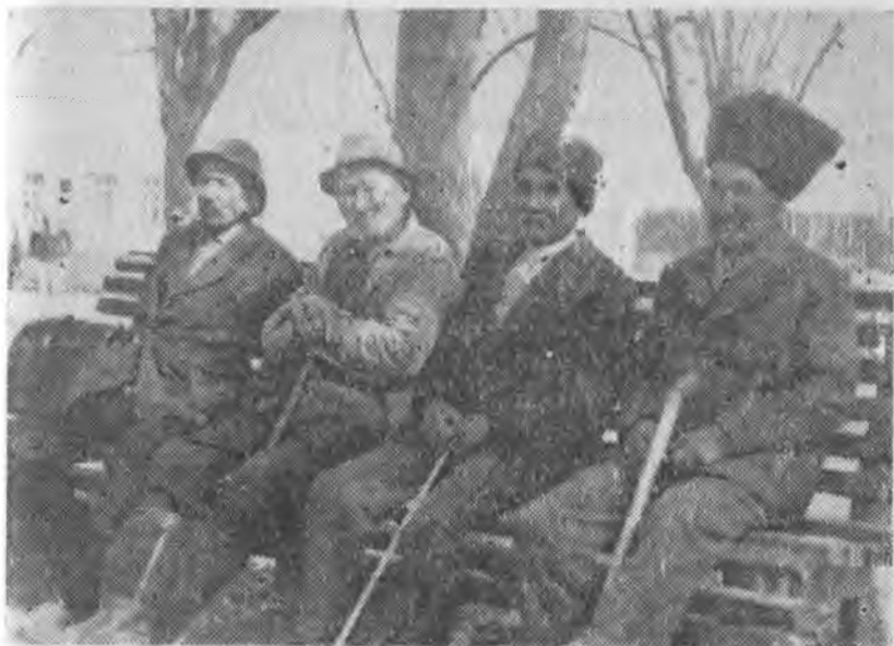
Рис. 4. Пожилые мужчины в традиционной и современной одежде, (Аул Терекли-Мектеб, 1976 г. Фото автора).

старики предпочитают брюки с широким шагом, с ромбовидной вставкой. Они свободней и не мешают движению. Подпоясывают брюки ремнем и, надевая на ноги носки домашне-го изготовления, заправляют в них штаны. Многие носят ка-лоши, реже чуваки, также кожаные сапоги (мес) местного производства.