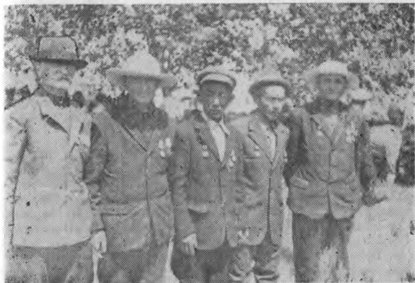
Рис. 9. Пожилые мужчины в традиционной и современной одежде. (Аул Адил-Халк, 1977 г.).

С одеждой связаны и некоторые обычаи. Например, одежда из одной семьи не передается другим, не родственным семьям. Внутри семьи, если брат или сестра переросли свою одежду, ее носят младшие. Как правило, дети очень редко одевают одежду родителей.