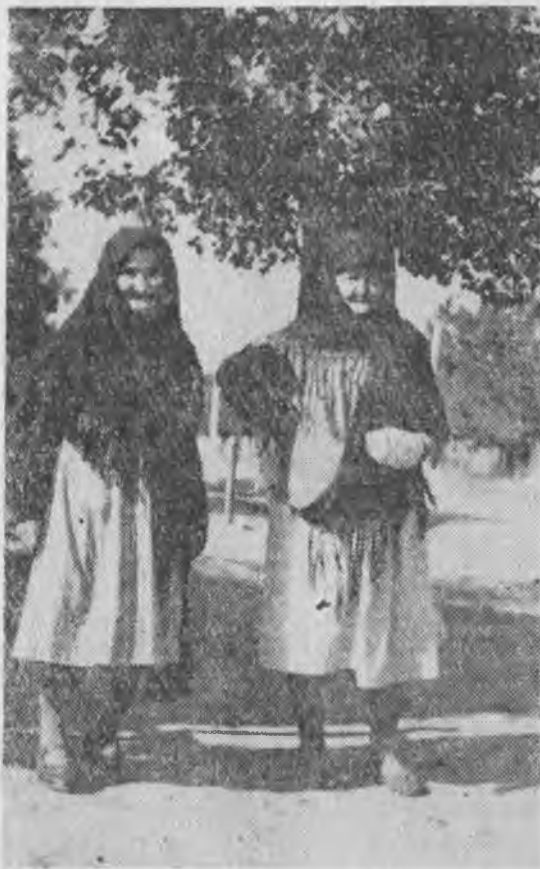
Рис. 6. Пожилые женщины в традиционной одежде, (Аул Эркин-Халк, 1974 г.).

Коренные изменения произошли в головных уборах девушек и женщин. Тюбетейку типа «такьяя», головные уборы