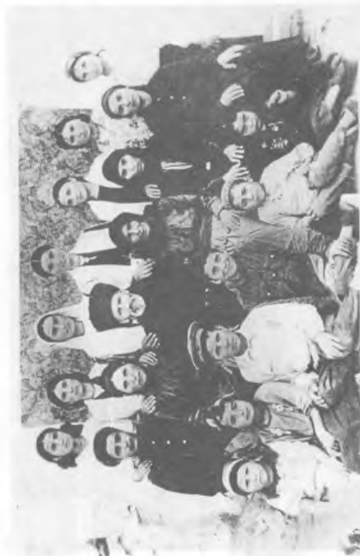
Семья Хапиевых, с. Пахта-Арал, 1949 г.