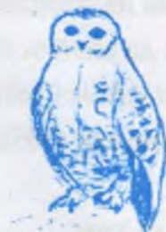
Гылын къуш (сова)