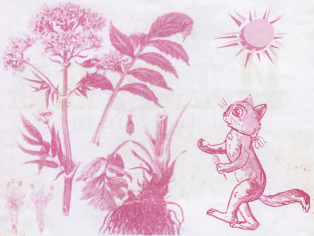
Джанджюрек, киштик оту (Валериана лекарственная) - Valeriana officinalis L.