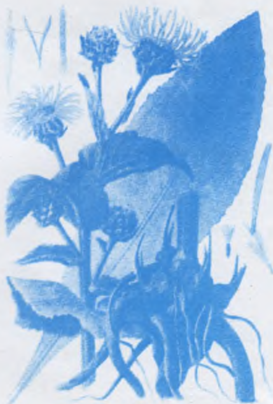
Андыз. Къара андыз. (Девясил высокий)