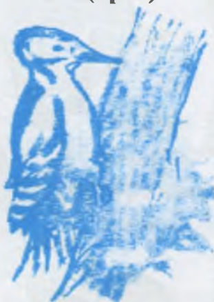
Агъач тауукъ (дятел)