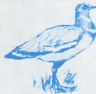
Къырым дуадакъ (стрепет)