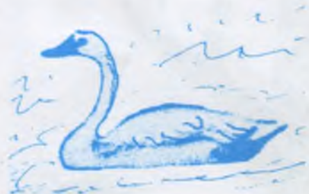
Къаз, дуадакъ, къангкъаз (лебедь)