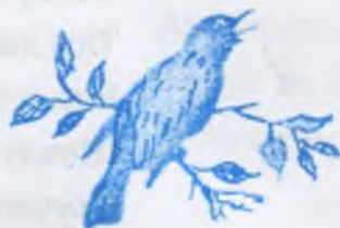
Къой чыпчыкъ (скворец)