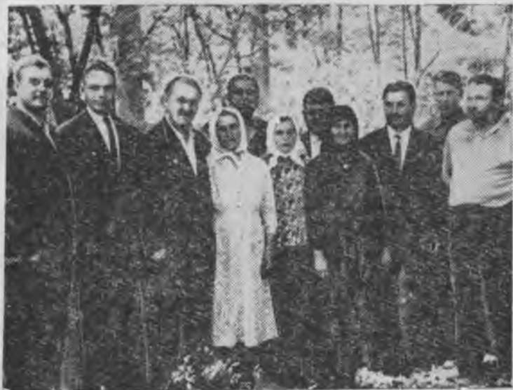
Кичибатырны партизан тенглери.

Аллайын Кичибатырны, Ююсю да кёб зат келе эди кёллерине, алай а джюреклерине ургъанны керн кыстай, бош затланы юсюден сёлеше эдиле. Къуру экиси чегетледе айлана, немецлеге къаллай чабыуулла этгенлерини, дагъыда кеб затны эслерине тюшюрдюле. Кичибатыр къаллай кючге къаршчы туругъа баргъанын экиси да иги ангылай эдиле. Къаты, къыйын сермешну боллугъун экиси да биле эдиле. Ююсю джюреги не эсе да къайгъылы эди. Экиси отрядлары бла кёб кере баргъандыла операцияланы тындырыгъа. Хар къуру да кете