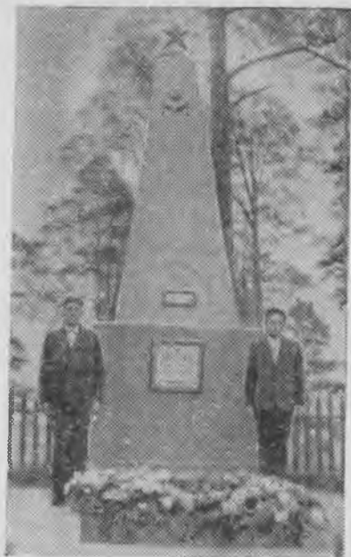
Кичибатырны кърнашы бла кърнашындан туугъан Кичибатыр асыралгъан джерде.