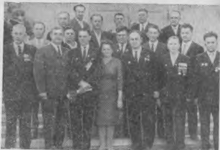
Кичибатырны партизан тенглери.

кёрюндю. Кичибатыр, аны эслеб, аллына атлады. Сабийчикни кёргенлей: