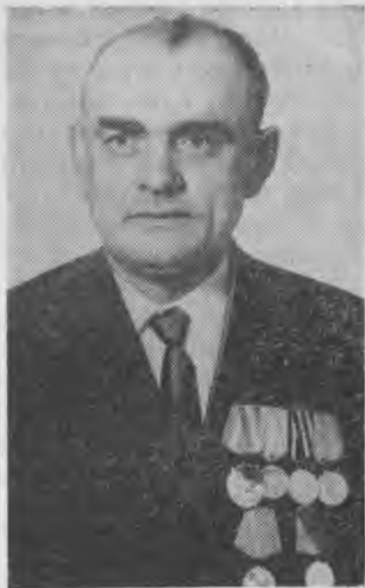
Сытенко В. Д. — Кичибатырны адъютанты.

— Иш кыйынды. Кеслери разылыкълары бла баргъанланы ал биргенге, — деди Леонов.