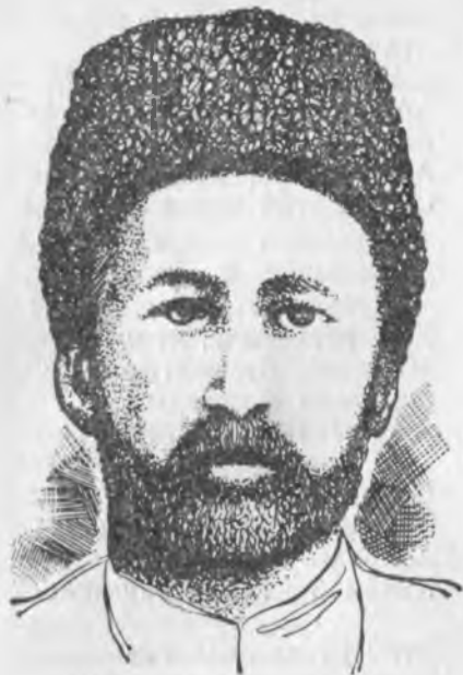
Акъбайланы Исмаил (1877—1938)

Акъбайланы Окъубну джашы Исмаил 1877-чи джыл Огъары Тебердиде туугъанды. Ол къарачай литератураны аллын башлагъанланы бириди, халкъгъа билим джайыу бла уа Исмаил кесини заманында эм кѳб этгенлени бирине саналады.