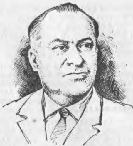
Залиханланы Джанакъайит (1917)

Белгили малкъар джазыучу Залиханланы Джанакъайит 1917 джылда Кенделенде туугъанды.