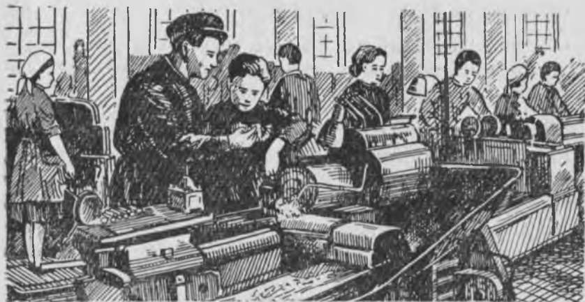
Ремесленое училищени мастерскоюнда.

Иш. Суратлагъа къараб, аланы теньлешдириб хапар къурагъыз.