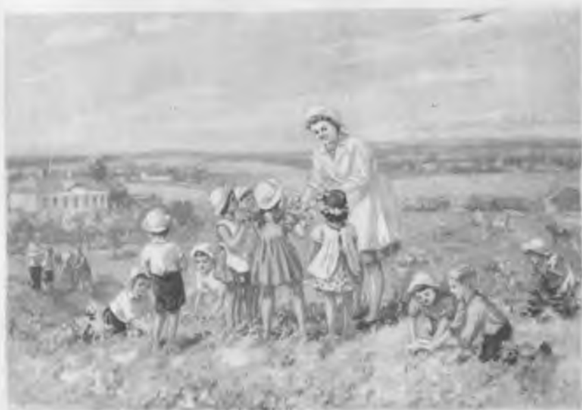
Детство теперь. Художник В. С. Баюскин.