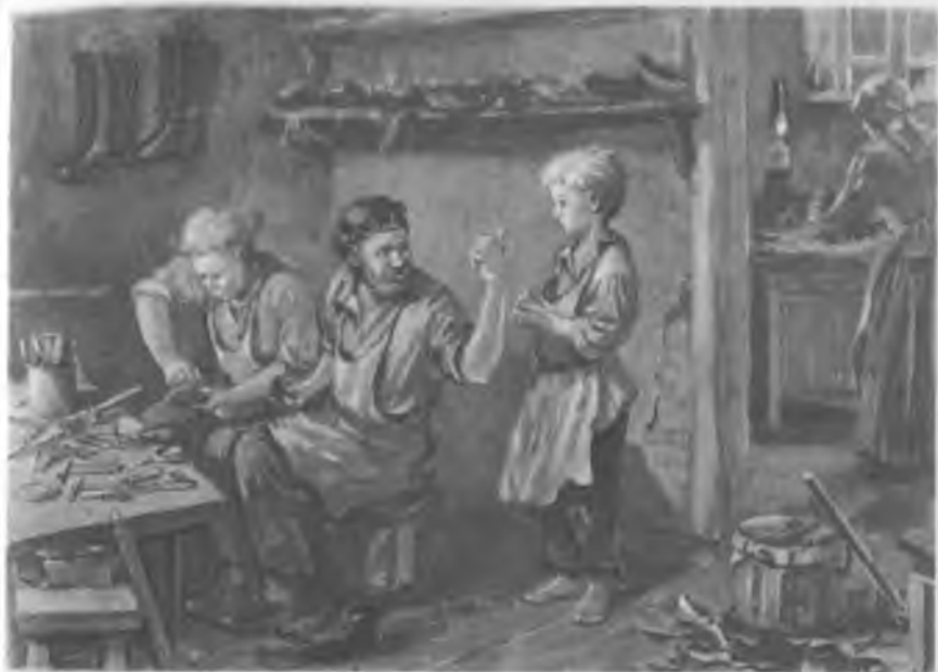
В ученье. Художник В. С. Баюкин.