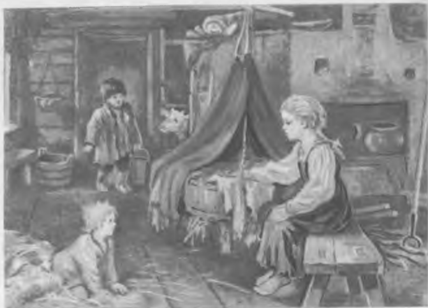
Детство прежде. Художник В. С. Баюскин.