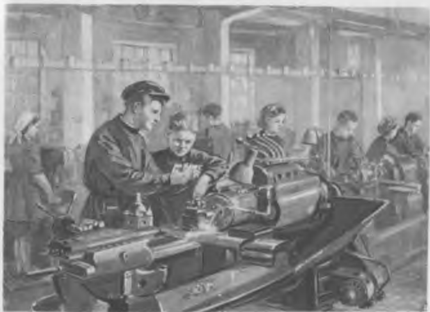
В мастерской ремесленного училища. Художник В. С. Баюкин.