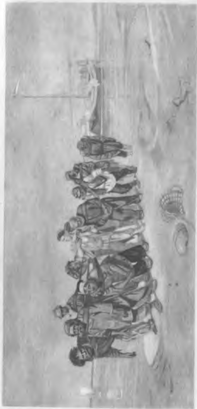
Бурлаки. С картины художника И. Е. Репина.