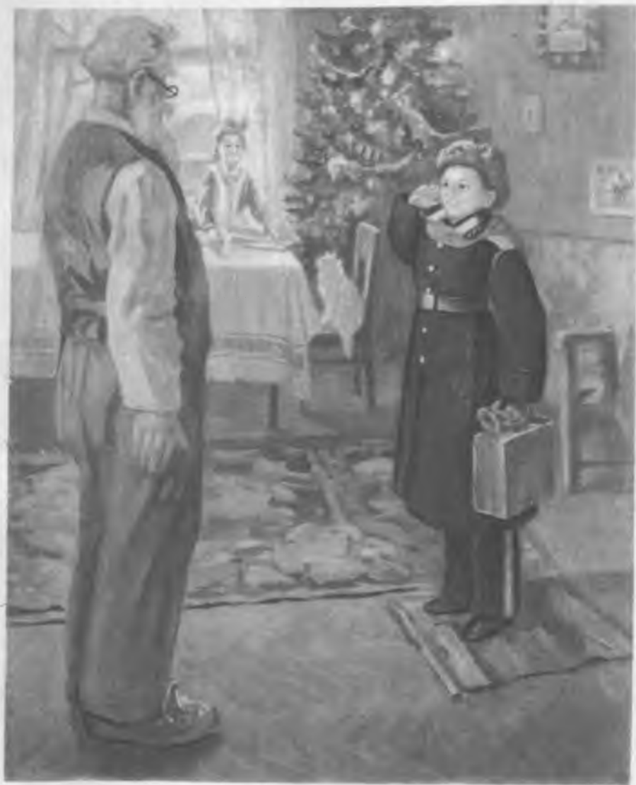
Прибыл на каникулы. С картины художника Ф. Решетникова.