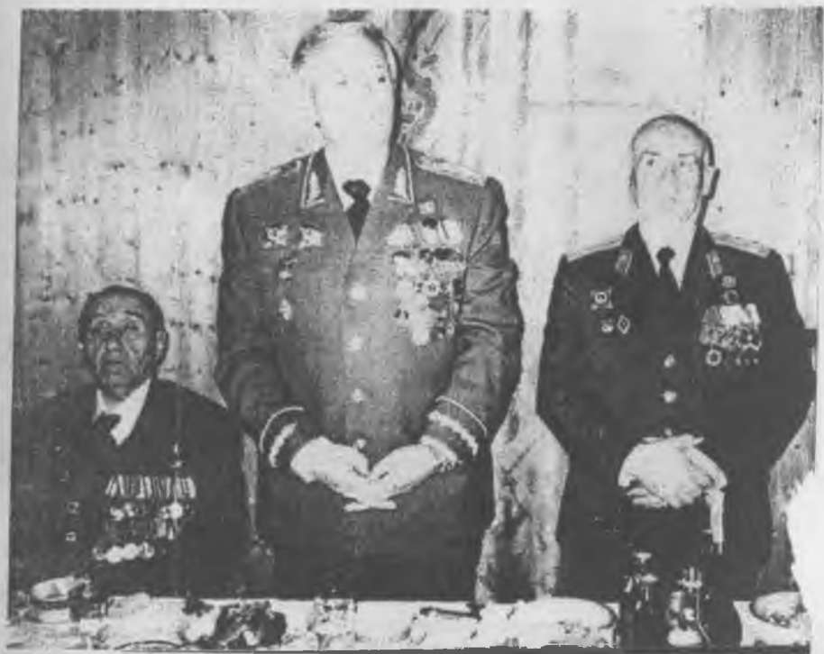
Генерал армии В.М. Семенов (в центре) Д.Т. Узденов и В.Б. Эркенов на встрече в день Победы, 2000