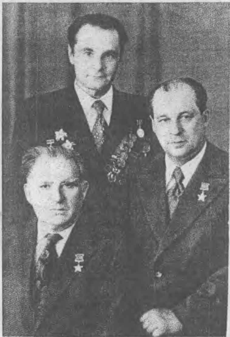
Герои Советского Союза А.П. Бринский и Ю.И. Онусайтис, И.И. Берсжной, 1975