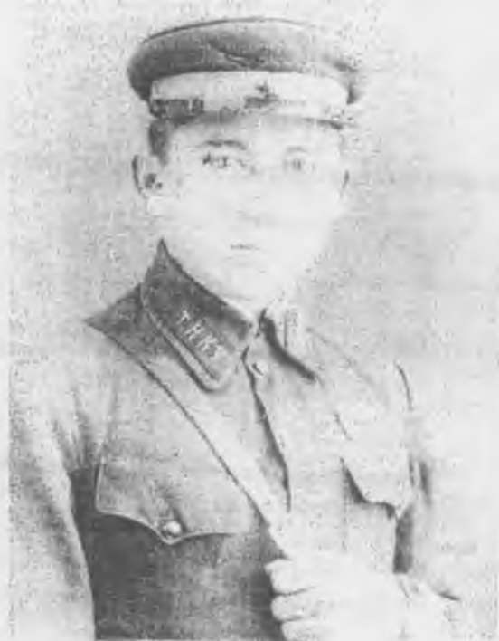
Курсант кавалерийского училища, 1938