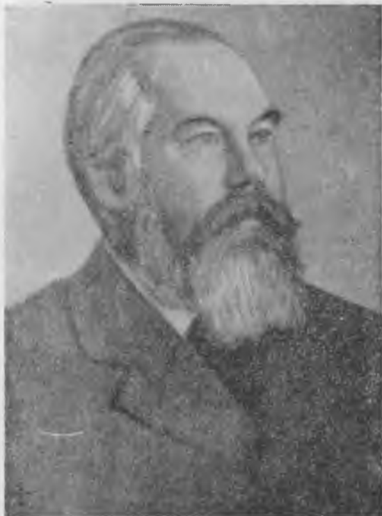
Танеев С. И.